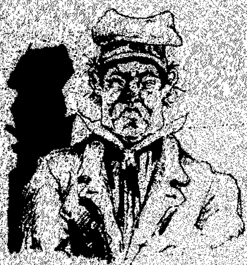
—Al quart pis. Ja emenci! aquest deu ser l'amo de algun cobman de l'uro.