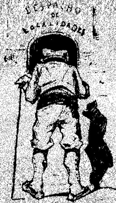
—Veyam, venenme un paperet que surti acomodn.