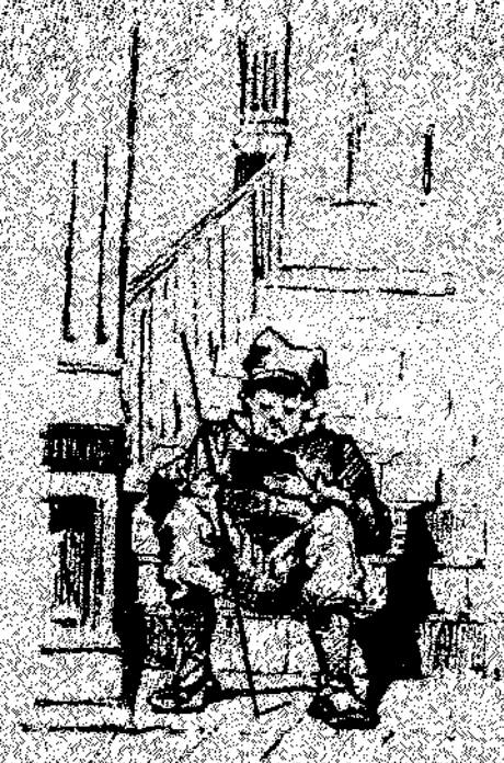
—Assentemsi. Si sabes de llegar com de número.