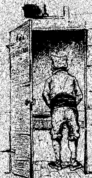
—Una paja per tel no m'ho pen-