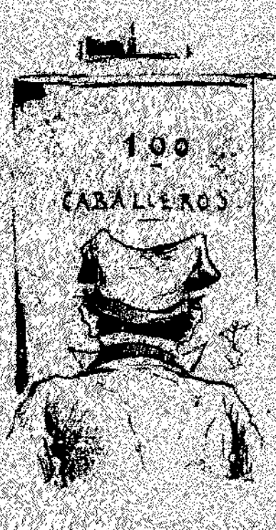
—Ara, ¿que no preguntu que id veig lo meu número?