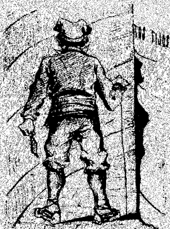
—Trem corredor avall.