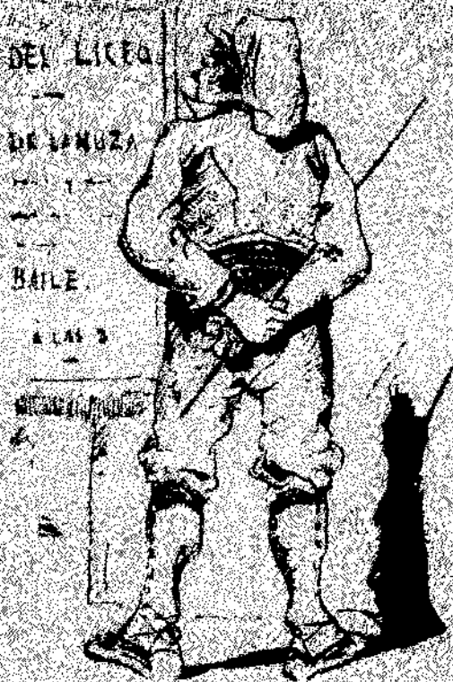
—¿Qué deuen ensenyar p'posar la ballea?