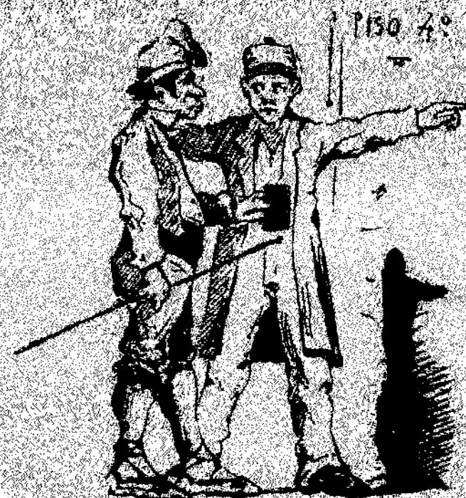
—Pujen la escala fins al quart pis: seguiri lo corredor y trobareu lo vuestre asiento.