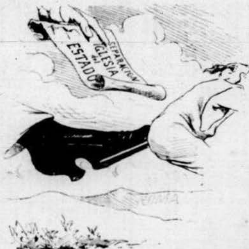
Contra avaricia LLIBERALITAT