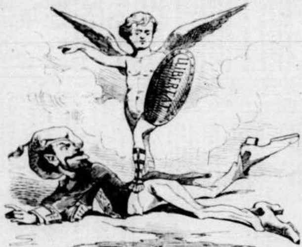
Contra superbia HUMILITAT

CONTRA AQUESTOS SET PECATS HI HA SET VIRTUTS