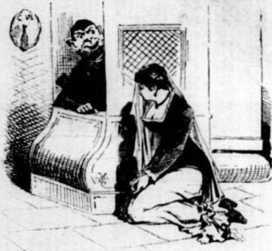
Lo tercer LUXURIA

CONTRA AQUESTOS SET PECATS HI HA SET VIRTUTS