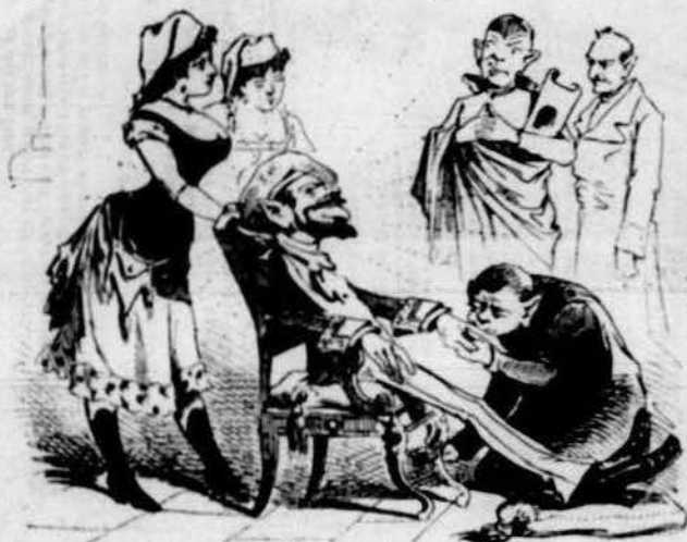
Lo primer SUPERBIA