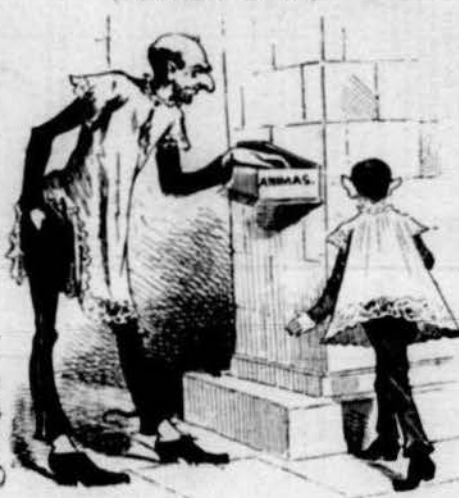
Lo segon AVARICIA