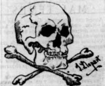
La pau definitiva.