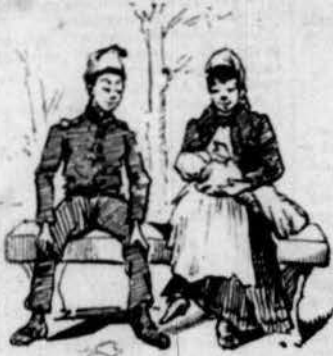
Siti a la plassa.