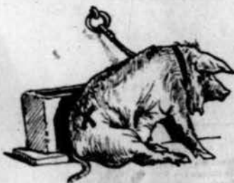
Un recluta disponible.