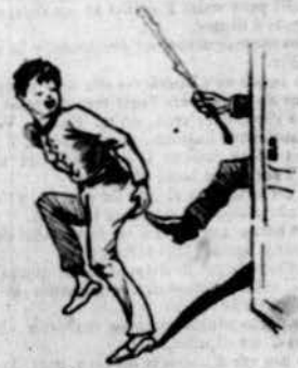
¡Manos a las cartucheras!