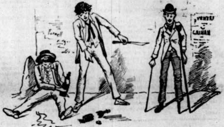
Dos héroes de la guerra.