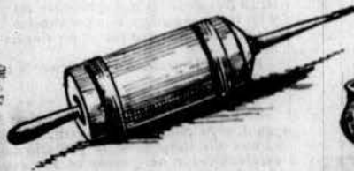
Atach per retaguardia.