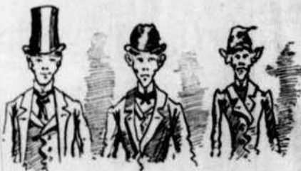
(Primer grau) (Segon grau) (Tercer grau) Ascens de grau (Tissis).