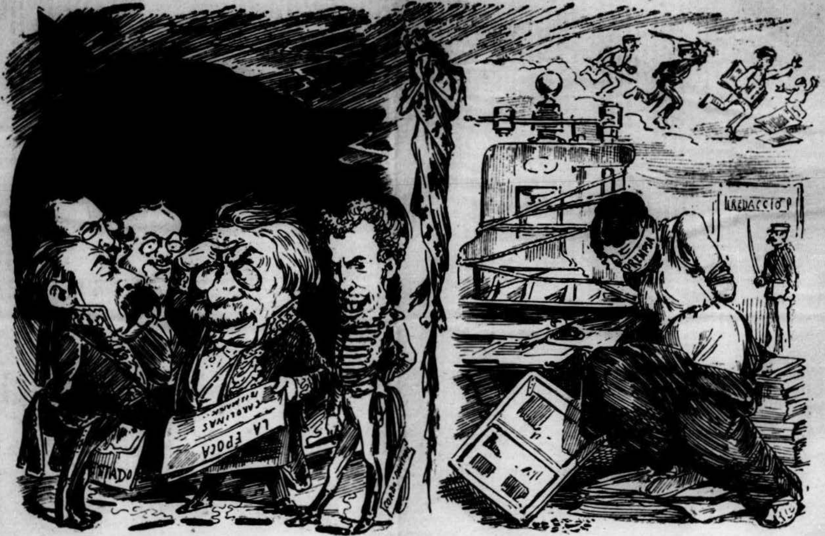
Qui 'n té la culpa.