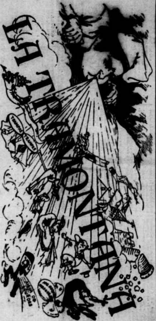
PARODIA POLITICA VARNELL.