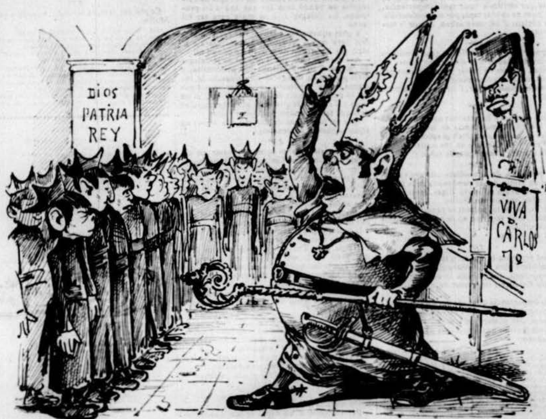
Ensenyansa en los seminaris