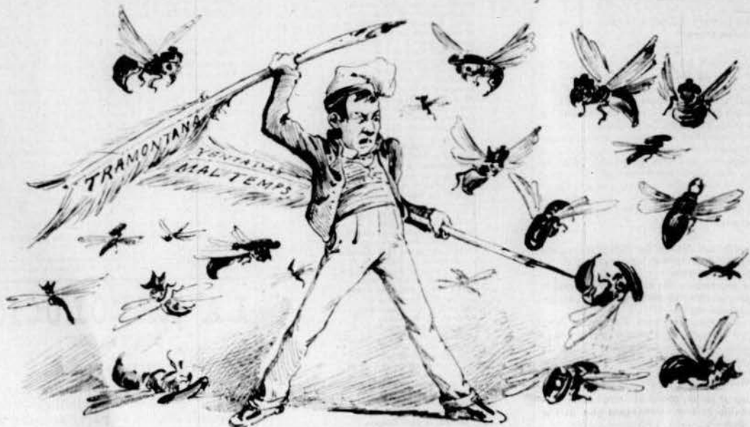
Aixám de moscas saballoneras amanint sos fitblons contra LA TRAMONTANA