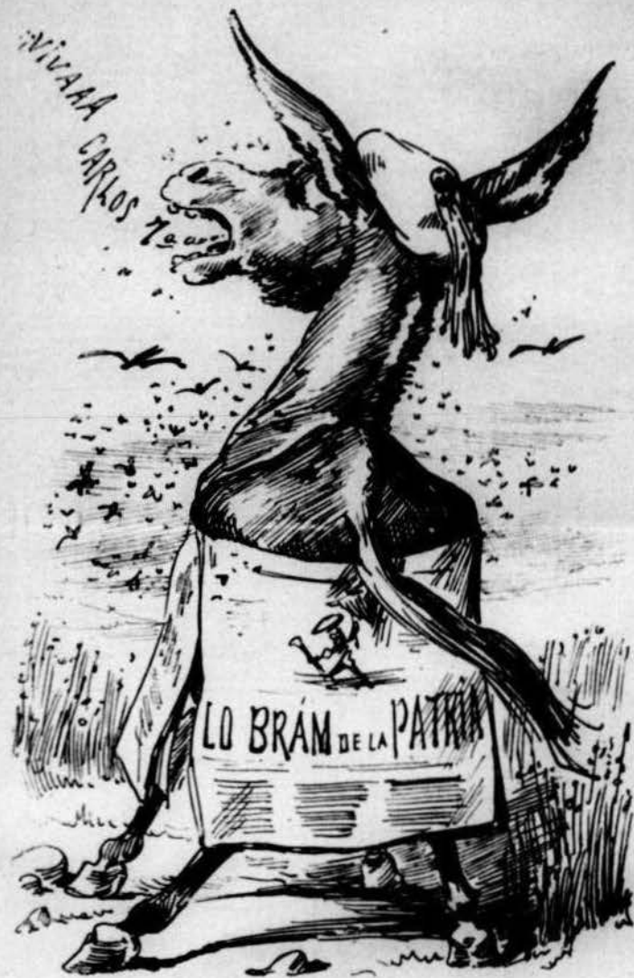
Aquest ruch té feyna en gran per en Carlos set bramant