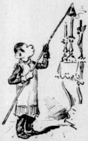
VIAJE MISTERIOS D' UN PASTOR Y UNA DONZELLA ILLUSTRAT AB CARICATURAS