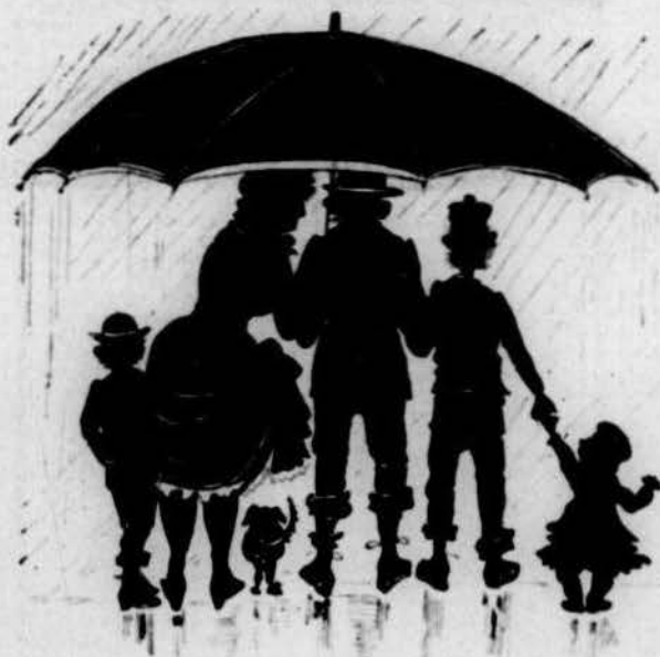
Parayguas de familia.