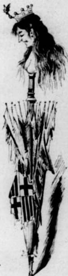
Agonia del parayguas.