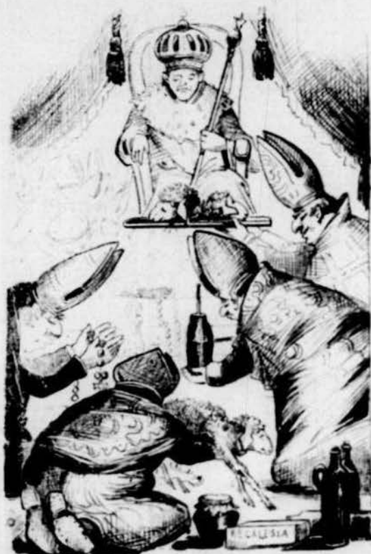
Mentres uns se diliquen la espina per collir de la llana 'l fruit més bó...