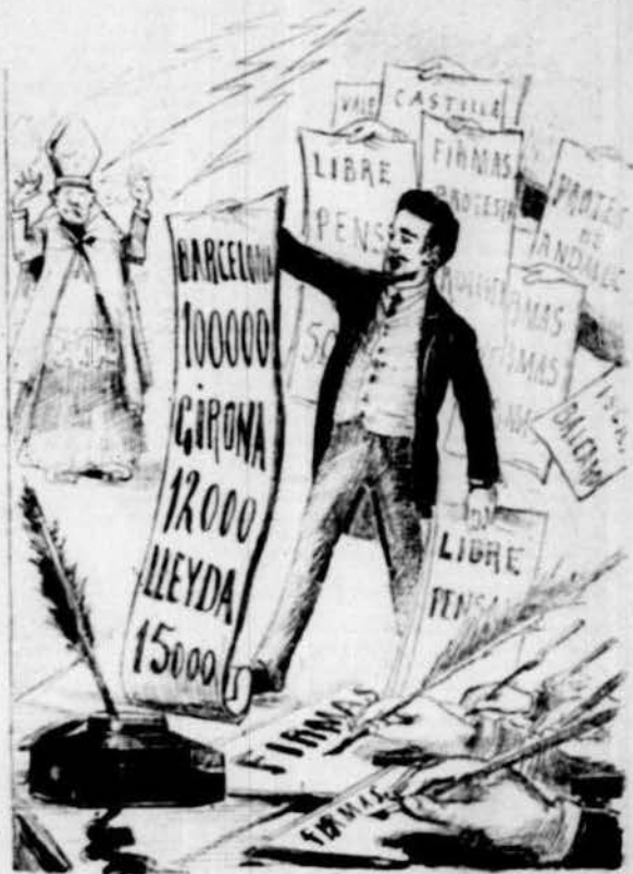
los lliures-pensadors passen bogada de clarell, protestant de tal funció