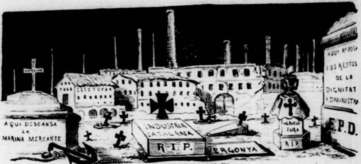
BARCELONA TAL COM ES