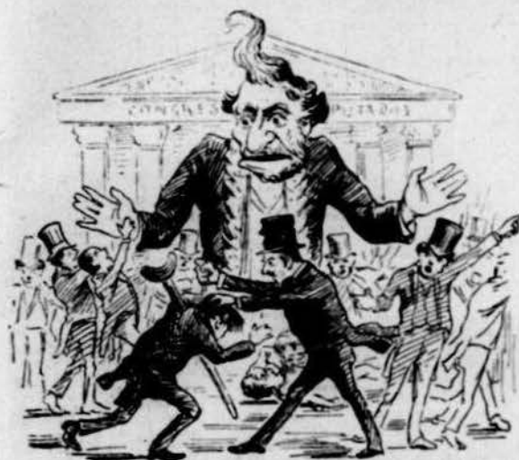
En mal dia: era divendres, van tindre rahons uns gendres.