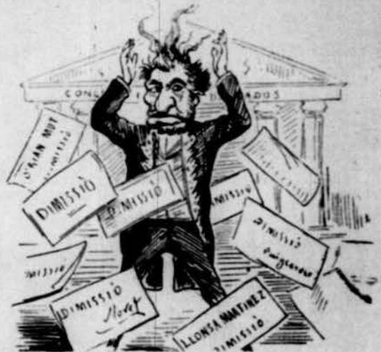
Resultat de las rahons: dels sogres las dimissions.