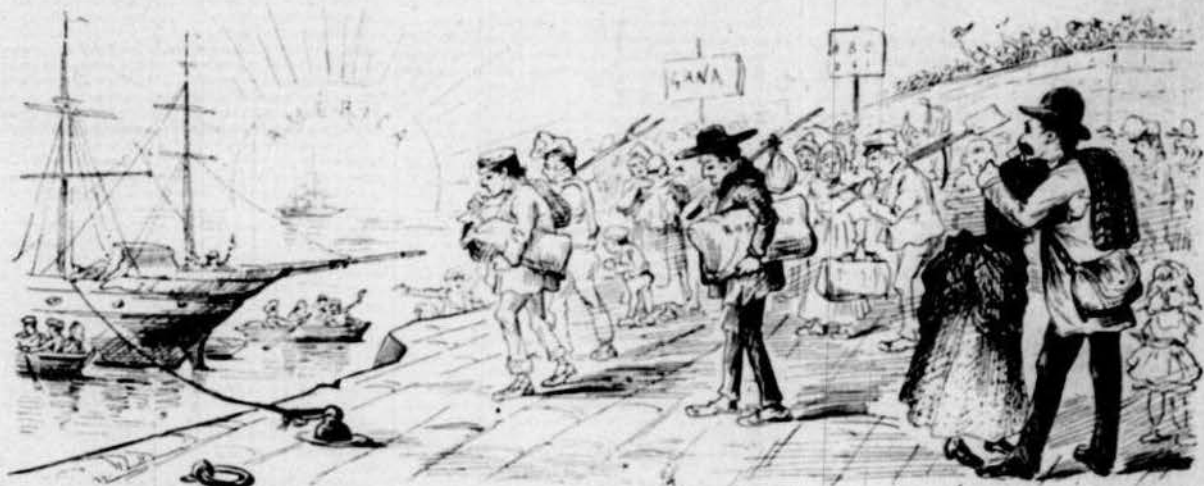
Los espanyols tenen d' emigrar à America à fi de no morir de fam en la mare patria.