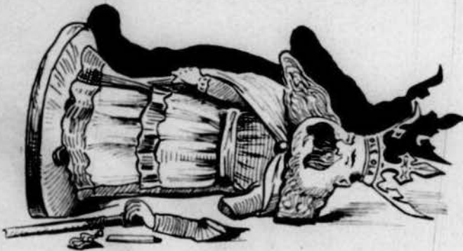
Una figura espatllada