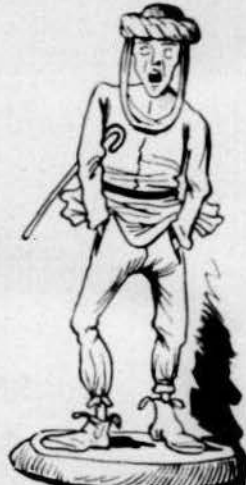
Empressari de cabras d'aquell tem