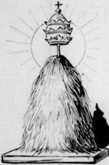
La palla d'una márrega