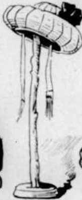
La gorra del ñiñu