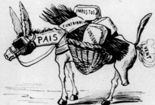
Un burro atropellat