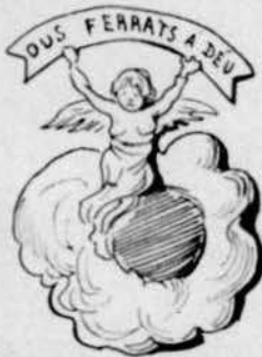
Anunciatas cuytas a la paella