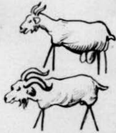
Una cabra y un cabró