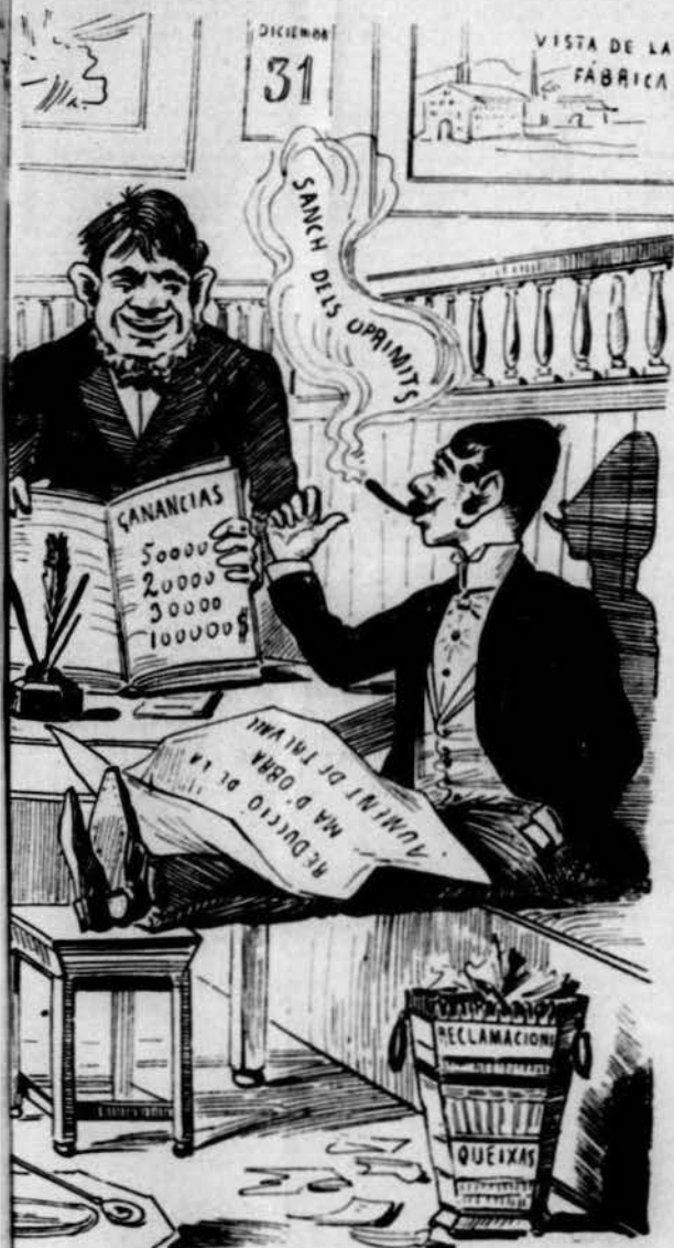
Resultat pels uns