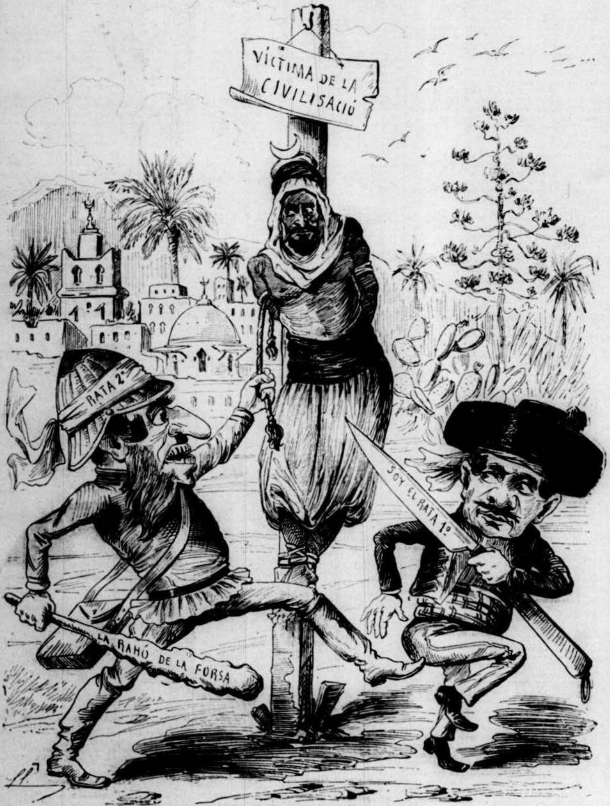
Demostració gràfica del conflicte anglo-portugués