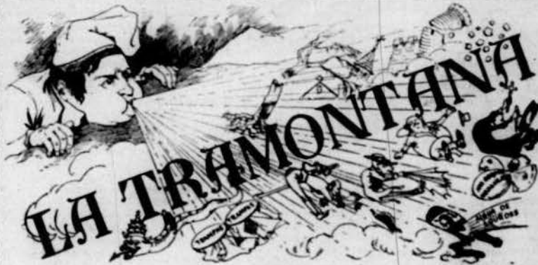
PERIÒDICH POLÍTICH VERMELL

No més drets sense debers. No més debers sense drets. Los drets individuals son imprescriptibles, ilegalsibles e ingarantibles. • Llegislar la Llibertat baix pretext de garantir-la, es cometre atentat contra ella. • La llibertat propia acaba allí ahont comensa la llibertat ajena. Es licit, donchs, al individu fer tot lo que no perjudiqui a un altre. • La resignació que predican las religions no es més que la fórmula del engany ab que s' preté perpetuar la injusticia social en lo mon. • Las religions son caixas d' ahorros que vihen de la estafa d' admetre capitals en la terra, assegurant pagar crescuts interessos al cel.