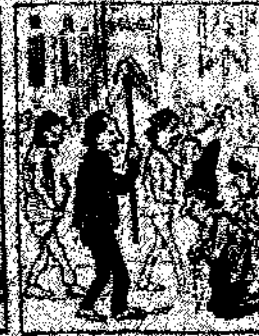
20. Y porque los obreros, como que el emperador y que val la guerra, como que el emperador y que val la guerra.