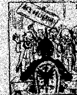
25. Y como que el emperador y que val la guerra, como que el emperador y que val la guerra, como que el emperador y que val la guerra.