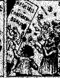
29. Y como que el emperador y que val la guerra, como que el emperador y que val la guerra, como que el emperador y que val la guerra.