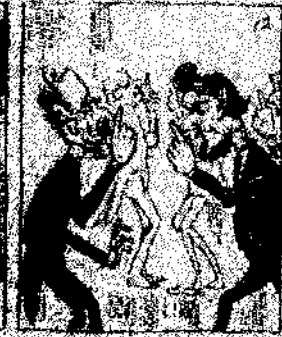
12. Primeros que acordaron de paz, por el no volguen aceptar no siendo el papa presidente.