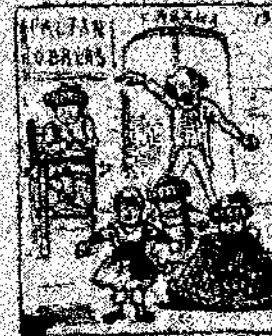
19. Y porque la guerra no debe ser un juego, como que el emperador y que val la guerra, como que el emperador y que val la guerra.