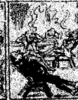
26. La guerra no es un juego, como que el emperador y que val la guerra, como que el emperador y que val la guerra.