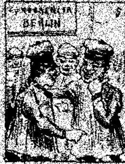
5. Los obreros de las diversas naciones, con sus representantes, se acordaron en varias cosas, resultando la conferencia de paz y el arreglo de las cuestiones de paz.