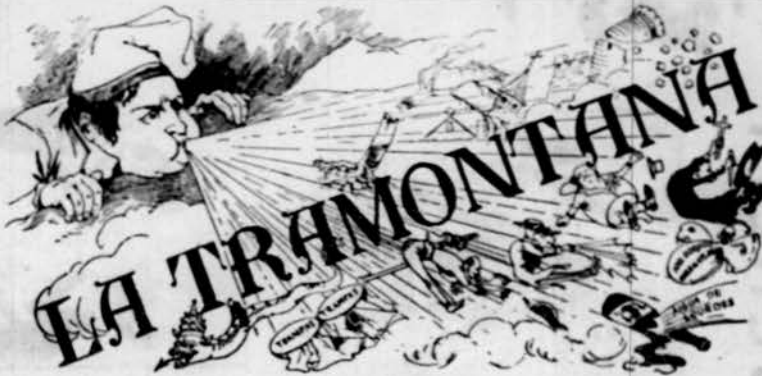
PERIÒDICH POLÍTICH VERMELL

No més drets sense debers. No més debers sense drets. Los drets individuals son imprescriptibles, ilegalsibles é ingarantibles. Legislar la Llibertat baix pretext de garantia, es cometre atentat contra ella. La llibertat propia acaba allí ahont comensa la llibertat ajena. Es licit, donchs, al individu fer tot lo que no perjudiqui a un altre. La resignació que predicen las religions no es més que la fórmula del engany ab que s'preté perpetuar la injusticia social en lo mon. Las religions son caixas d'ahorros que viuen de la estafa d'admetre capitals en la terra, assegurant pagar crescutos interessos al cel.