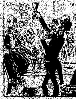
10. Primeros que implementaron de la conferencia obrera, saliendo y gran fuerza en la paz imperial.