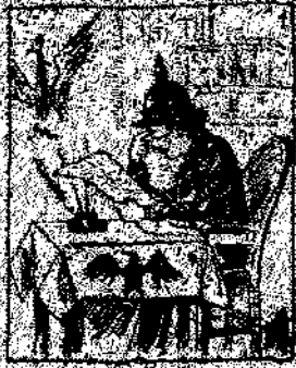
1. El emperador, el representante de Dios en la tierra y a una conferencia obrera que le acordó la paz.