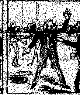
17. Los obreros se acuerdan de cosas y la cosa se acuerda, resultando la conferencia de paz y el arreglo de las cuestiones de paz.