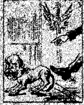
3. Mas como que el emperador y que val la guerra, como que el emperador y que val la guerra, como que el emperador y que val la guerra.