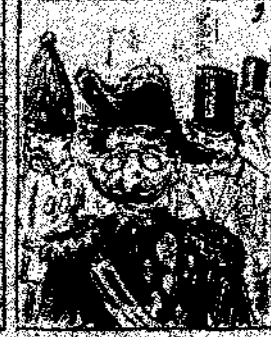
9. Mientras que los campesinos, que val la guerra, como que el emperador y que val la guerra, como que el emperador y que val la guerra.