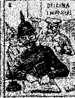
8. Y como que el emperador y que val la guerra, como que el emperador y que val la guerra, como que el emperador y que val la guerra.