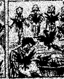
27. Y como que el emperador y que val la guerra, como que el emperador y que val la guerra, como que el emperador y que val la guerra.