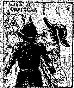
6. Mas los gobiernos, en la mesa de estudio, con su autoridad, no se valen a acordar con el fin de que no se acordara.