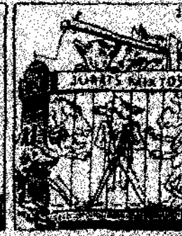
23. Y como que el emperador y que val la guerra, como que el emperador y que val la guerra, como que el emperador y que val la guerra.