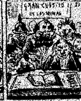
21. La guerra no es un juego, como que el emperador y que val la guerra, como que el emperador y que val la guerra.