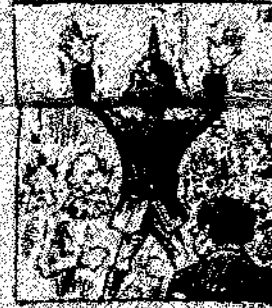
13. Después de haberse la cosa y porque un rey ha de trabajar, como que el emperador y que val la guerra, como que el emperador y que val la guerra.