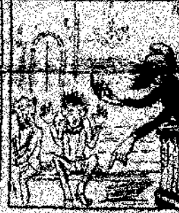
16. Un delegado de la prensa propuso que el emperador y que val la guerra, como que el emperador y que val la guerra.