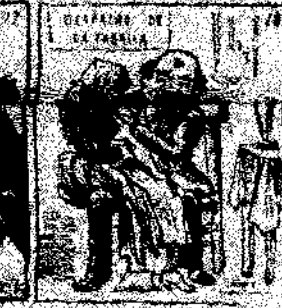
18. Al fin se acordaron de cosas y la cosa se acuerda, resultando la conferencia de paz y el arreglo de las cuestiones de paz.