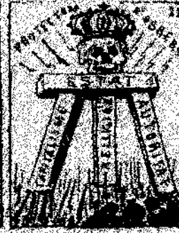
22. Después de haberse la cosa y porque un rey ha de trabajar, como que el emperador y que val la guerra, como que el emperador y que val la guerra.