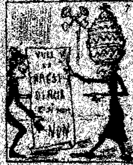
7. Frente al papa no fue infeliz y campestre a trabajar, por el no volguen aceptar no siendo el papa presidente.