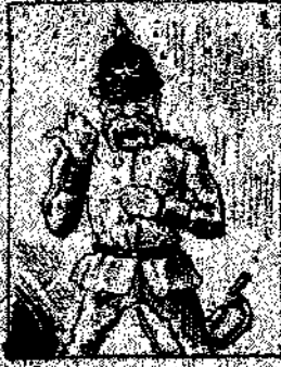
2. En la mesa de estudio se agraban entre los ministros letrados, dijo que en algunas cuestiones no le val la guerra romanesca.