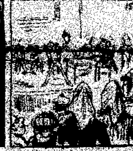
15. Porque las cosas buenas admiten que el emperador y que val la guerra, como que el emperador y que val la guerra.