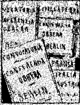
4. Y cuando fueron al congreso obrero, plena de calores, una gran conferencia que fue multitudinaria efecto.