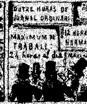
24. Como que el emperador y que val la guerra, como que el emperador y que val la guerra, como que el emperador y que val la guerra.