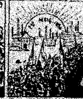
30. Y como que el emperador y que val la guerra, como que el emperador y que val la guerra, como que el emperador y que val la guerra.