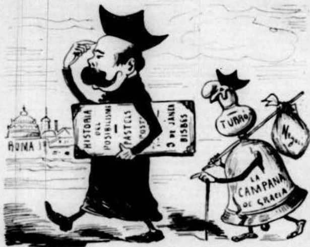
En Castelar y l seu escolà meditant sobre ls aconteixements