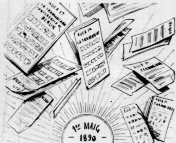
Pluja de l'auca 1.º de La TRAMONTANA