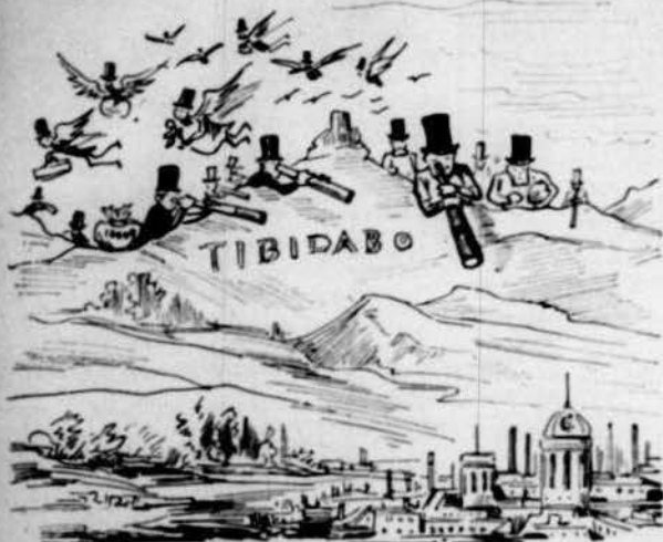
Situació de la burgesia barcelonina