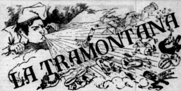
PERIÒDICM POLÍTICH VERMELL

De nos altres cosa sobra. De nos altres cosa sobra. Los drets individuals son imprescriptibles, legisla- bles e ingarantibles. • Legislar la Llibertat baa pretext de garantiria, es co- metre atentat contra ella. • La llibertat propia acaba all ahont comensa la llibertat ajena. Es licit, donchs, al individu fer tot lo que no perjudici a un altre. • La resignació que predican las religions no es més que la fórmula del engany ab que s' preté perpetuar la in- justicia social en lo mon. • Las religions son caixas d' ahorros que viuen de la cotata d' admetre capitals en la terra, assegurant pagar erancuts interanals en el.