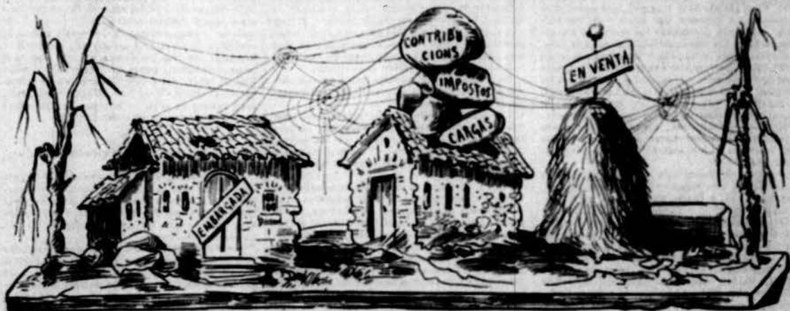
Casetas y bens del contribuyent