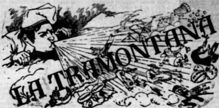
PERIÒDIC POLÍTIH VERMELL

De més drets sense cobers. De més llibertat sense drets. Los drets individuals son imprescriptibles, legisla- bles i INGANANTIBLES. • Legislar la Llibertat baix pretext de garantiria, es co- metre atenta contra ella. • La llibertat propia acaba allí ahont comença la llibertat ajena. Es licit, donchs, al individu fer tot lo que no perjudiqui a un altre. • La resignació que predican las religions no es més que la fórmula del engany ab que's preté perpetuar la in- justicia social en lo mon. • Las religions son castas d'aborros que viuen de la estafa d'admetre capitals en la terra, assegurant pagar eroscuts interessos al cel.