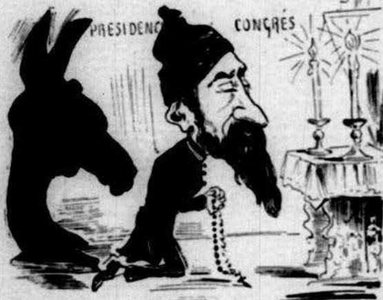
S' encomana á Deu y als sants perque li surtin be 'ls plans.