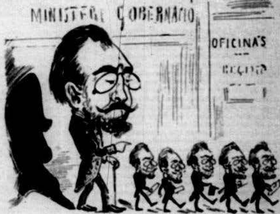
Aquest son talent revela colocant la parentela.