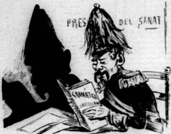
Com ell per res s' acobarda, apren gramática... parda.