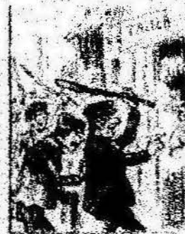
Y como obreros del día que el día del 1.º de Maig, una bandera tal es por el día del 1.º de Maig.