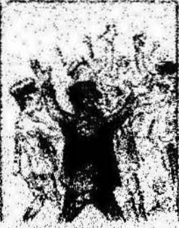
Los que han estado por nosotros contando con el parlamento, y ahora la revolución al camp de los Catalanes.