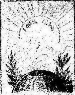
Y como obreros del día que el día del 1.º de Maig, una bandera tal es por el día del 1.º de Maig.