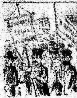
Y como obreros, con campana de la que cubren por el día de la huelga.