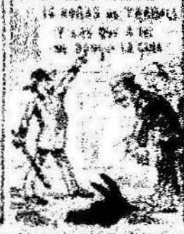
Los que han estado por nosotros contando con el parlamento, y ahora la revolución al camp de los Catalanes.