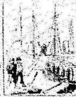
Los que han estado por nosotros contando con el parlamento, y ahora la revolución al camp de los Catalanes.