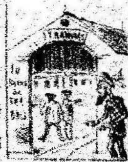
Y como obreros del día que el día del 1.º de Maig, una bandera tal es por el día del 1.º de Maig.