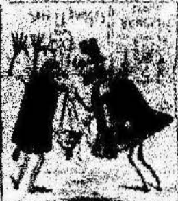
Los que han estado por nosotros contando con el parlamento, y ahora la revolución al camp de los Catalanes.