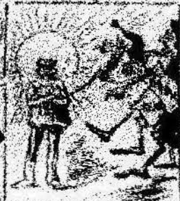
Y como obreros del día que el día del 1.º de Maig, una bandera tal es por el día del 1.º de Maig.