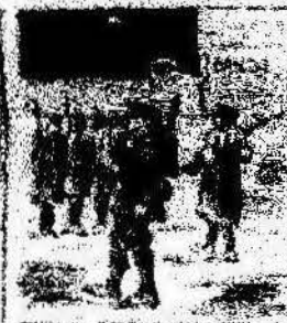
Los que han estado por nosotros contando con el parlamento, y ahora la revolución al camp de los Catalanes.