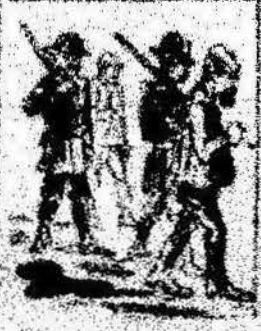
Los que han estado por nosotros contando con el parlamento, y ahora la revolución al camp de los Catalanes.