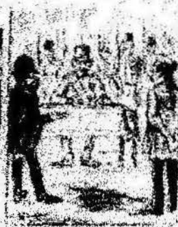
Los que han estado por nosotros contando con el parlamento, y ahora la revolución al camp de los Catalanes.