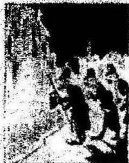
Y como obreros del día que el día del 1.º de Maig, una bandera tal es por el día del 1.º de Maig.