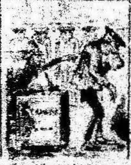
Y como obreros del día que el día del 1.º de Maig, una bandera tal es por el día del 1.º de Maig.