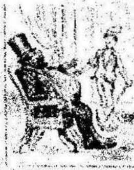
Y como obreros del día que el día del 1.º de Maig, una bandera tal es por el día del 1.º de Maig.