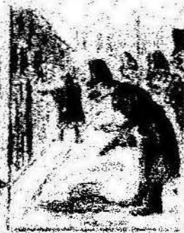
Y como obreros del día que el día del 1.º de Maig, una bandera tal es por el día del 1.º de Maig.