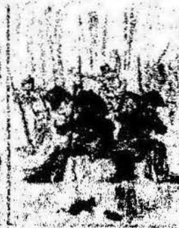
Los que han estado por nosotros contando con el parlamento, y ahora la revolución al camp de los Catalanes.