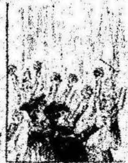
Los que han estado por nosotros contando con el parlamento, y ahora la revolución al camp de los Catalanes.