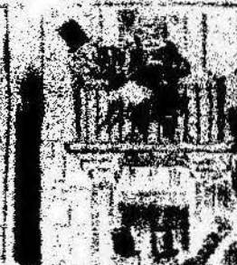
Y como obreros del día que el día del 1.º de Maig, una bandera tal es por el día del 1.º de Maig.