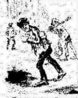
Y como obreros del día que el día del 1.º de Maig, una bandera tal es por el día del 1.º de Maig.