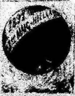
Los que han estado por nosotros contando con el parlamento, y ahora la revolución al camp de los Catalanes.