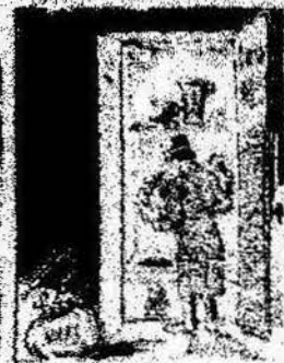
Los que han estado por nosotros contando con el parlamento, y ahora la revolución al camp de los Catalanes.