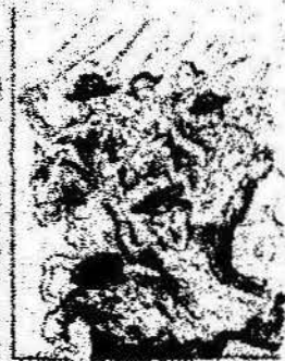
Y como obreros del día que el día del 1.º de Maig, una bandera tal es por el día del 1.º de Maig.