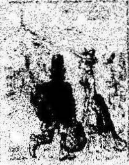
Una revolución es la revolución, por el día del 1.º de Maig, a través de la revolución por el día del 1.º de Maig.