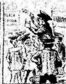
Los que han estado por nosotros contando con el parlamento, y ahora la revolución al camp de los Catalanes.