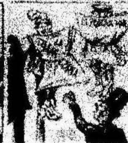
Los que han estado por nosotros contando con el parlamento, y ahora la revolución al camp de los Catalanes.