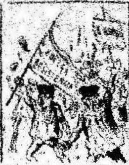
Y ahora obreros del día que el día del 1.º de Maig, una bandera tal es por el día del 1.º de Maig.