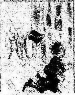
Y nosotros la revolución aquesta revolución, de que se convierten a través por el día del 1.º de Maig.