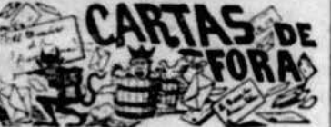
La Riba 13 Juliol de 1891.

Y aquestos y altres exemples que desgraciadament se veuben massa sovint, fan que 'l poble miri ab certa repugnancia la administració de justicia, que en lloch de tenir que ser sempre 'l amparo del débil y 'l desgraciat, resulta moltes vegadas lo terror de la gent de be.