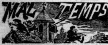
A pesar de la ley del descans dominical tan mposada pel clero, lo diumenje al mati se des-

carregaren en aquesta ciutat dues campanas en la iglesia de Betlém, y un carreter per més senyas hi prengué mal xaixantshi dos dies que li tingueren de ser amputats. Sempre al clero se li ha d'aplicar lo de fet lo que 'l digui y no miris lo que faig.