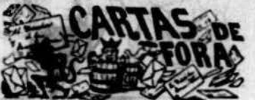
La Pobla de Claramunt 7 Agost 1891.

Ara sols falta, pera que 'l quadro resulti acabat, que tot lo rigor de la llei caygui demunt d'alguns dels intel·ligents enganys, mentres los enganyadors disfrutin tranquilament del fruit de son delictu é intenten deshonrar las ideas revolucionarias y de donar fors a las tiranias existents.