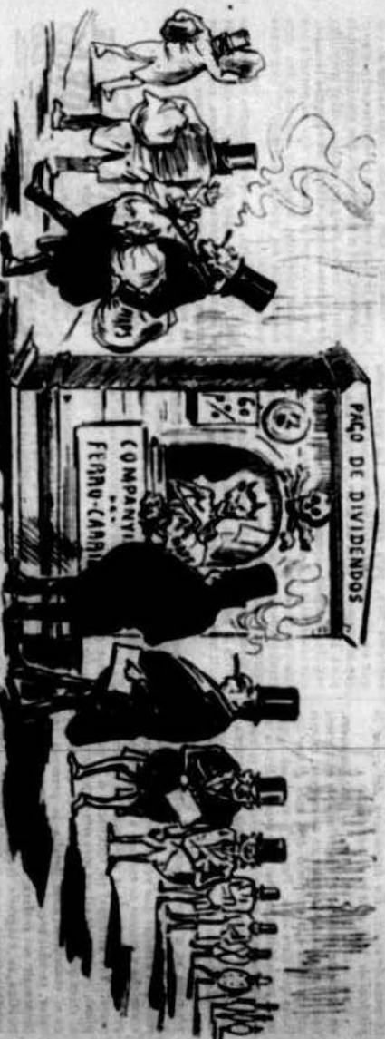
Y l' argument resulta d' aquest vice ab un gros tant per cent de benefici.