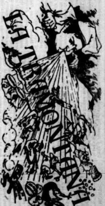
PERIODICH POLITICH VERRALL

En tots aquests casos els drets de tots els individus són iguals i no hi ha cap privilegi. La Llibertat proposa un altre model de govern, on totes les decisions són preses pels ciutadans o pels seus representants elegits. La Llibertat proposa un altre model de govern, on totes les decisions són preses pels ciutadans o pels seus representants elegits.