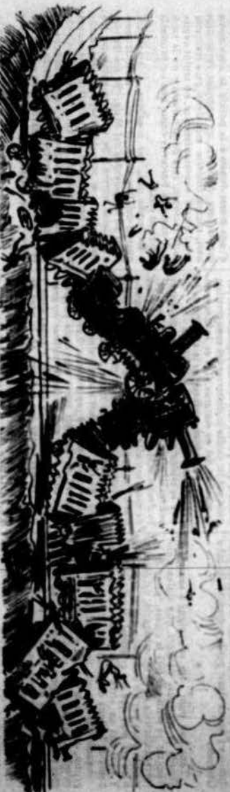
Esvaliant las empreses molts jornalsh resulten tot soriant aqueusos mala.