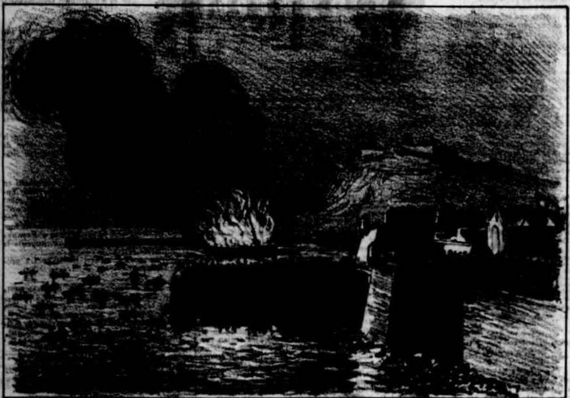
Crema del Pontón, odiat barco que havia servit de inquisició política, en lo port davant de las Dressanas.