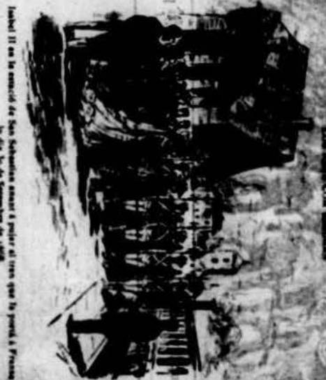
Tabel II se ha movido de San Sebastian para ir a mirar el tipo que se puede hacer en la zona de Euzkadi...