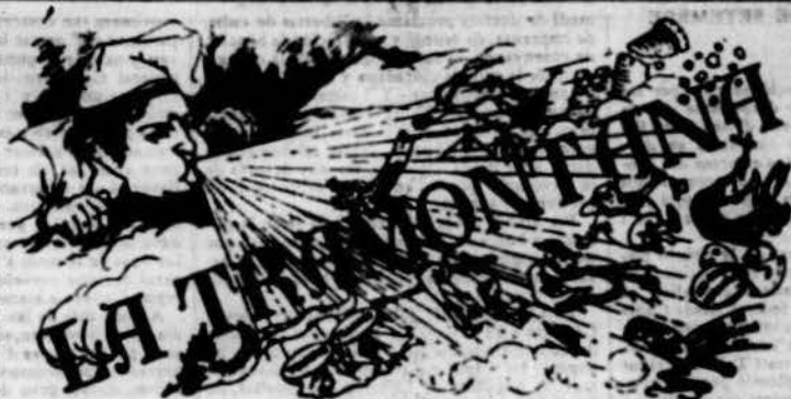
PERIÒDICH POLÍTICH VERMELL

De més fruits sempre debem. De més debem sempre fruits. Los fruits individuals son improscriptibles, ilegals, legals é inalienables. o Legislar la Llibertat baix pretext de garantia, es co- metre atencat contra ella. La llibertat propi acaba allí abont comença la llibertat ajena. Es licit, donchs, al individu fer tot lo que no perjudiqui a un altre. La resignació que predican las religions no es més que la fórmula del engany ab que s' presté perpetuar la in- justicia social en lo mon. Las religions son caixas d' aborrisos que viuen de la patada d' admetre capitals en la terra, assegurant pagar decents interessos al col.