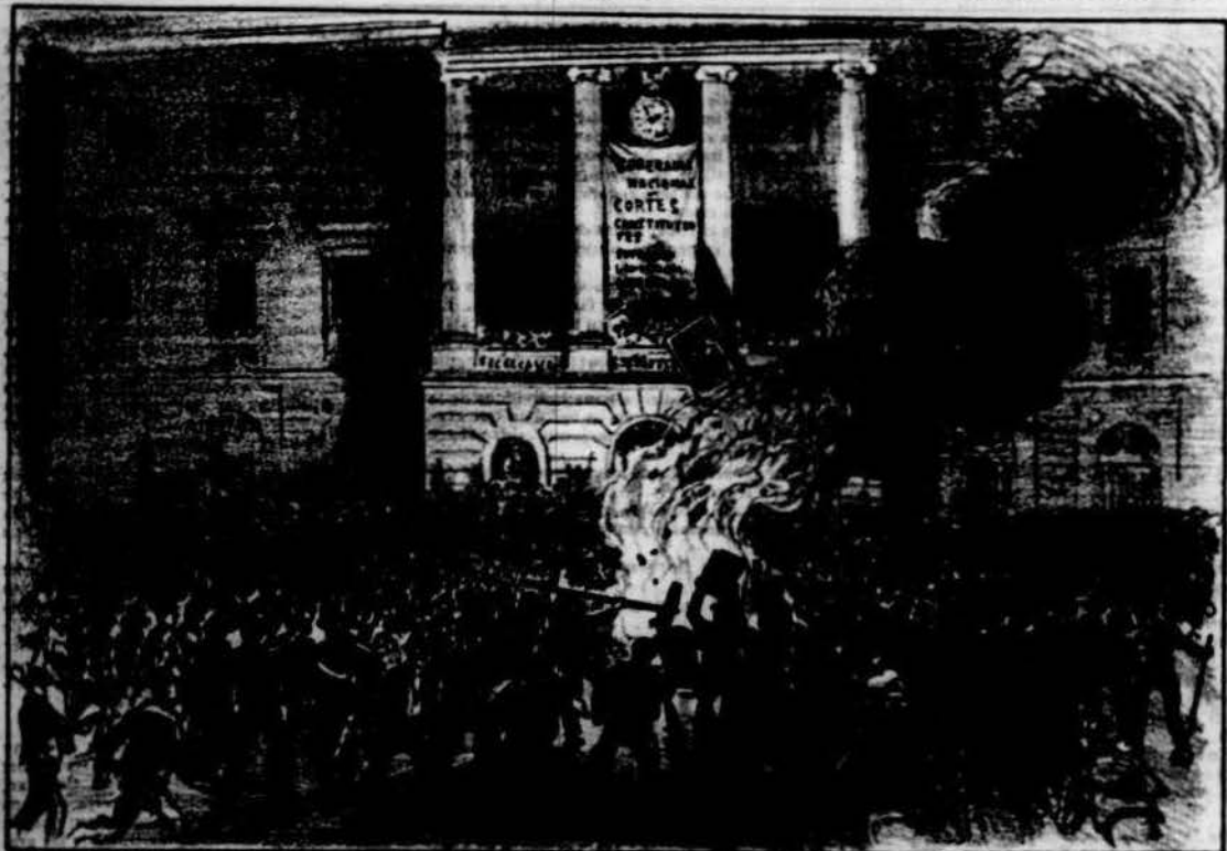
Proclamació de la Revolució y crema dels retrats reals y altres trastos en la plassa de Sant Jaume.