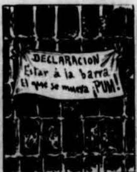
Foren del burgès felló las mentidas propaladas, pels presos contrareastadas ab ferma Declaración.