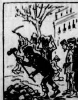
Y encar que causi condol, precisa aqui confessar que la huelga's va acabar resultant un bon bunyol.