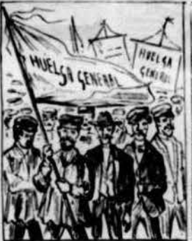
Ferms no obstant se mantenían en huelga varios oficis, que n' eran segurs indicis de que molts los seguirian.