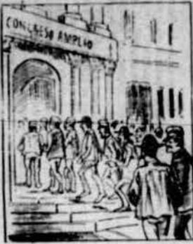
Ab entusiasta esperit per veure al Maig què's farà l'1. er pel Abril se celebra un Congrés Ampli a Madrid.