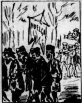
Y la huelga comensant pels quins més la lam rosega, los del partit dormilega los anavan contrariant.