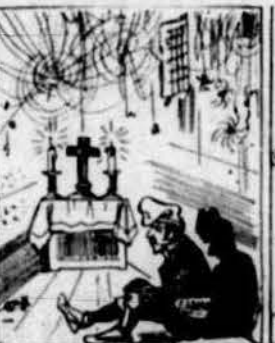
Perque aquell lloch li fes mella y's convertís ben aviat, del tot incomunicat me l' van posar a la capella.