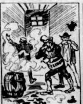
Portat a Governación y tancat al calabosso, allí si que aquell bon mozo ne va beure de pudó.