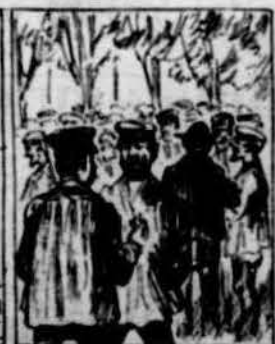
L' obrer d' aixó'n tru en clar, porque ha tocat sos defectes, que no convé sos projectes a pllasso l'eco anunciar.