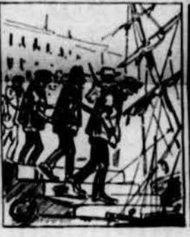
Pera sembrar lo terror entre ls que huelga volian, las autoritats glatian embarcacion ab rencor.