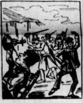
Y ab tanta persecució s' armá un farrigo-farrago, que un trago ja era un estrago y una acció una coacció.