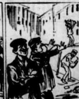
Uns socialistas sofistas, porque la huelga's perdía demostravan alegría; ¡vaya uns caps de socialistas!