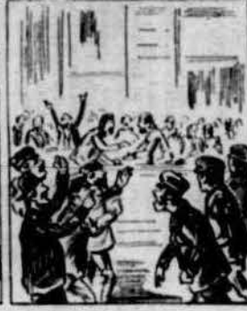
Mes com a bons espanyols no's van avindre a Madrid, y per qüestions de partit comensaren los bunyols.