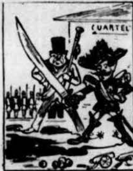
En tent las autoritats per defensar al burgès, se preparan ab excés pera fer atrocitats.