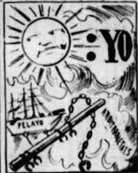
Un casi-menja-anarquistas hi va haver a Barcelona, que va posar sa persona a unas alturas may vistas.