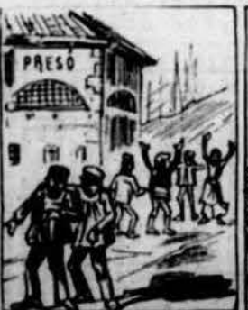
Un mes aixís va transcorre per la pó'l burgès deixar, y luego van comensar a treure obrero de la torre.