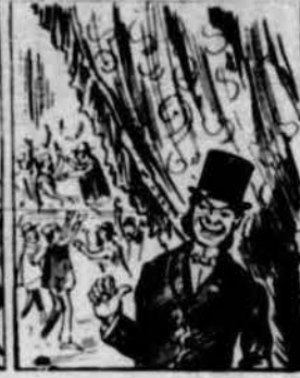
Si l'un la huelga volia l'altre ja volia lo contrari, y en disputa temeraria fan riure a la burgèsia.