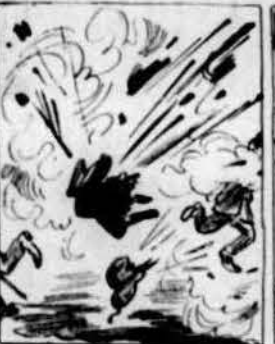
Mes tot d'un plegat llavors, sens esperar més retardos, van esclatar uns petardos ab intencions molt traydorás.