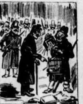
Las explosions referidas van causa' ls següents disgustos: dos canaris morts de sustos y tres rajolas feridas.