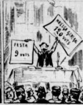
Gran majoria no obstant per la huelga's decidí, per més que uns poquets d'allí duyan molt diferent plan.