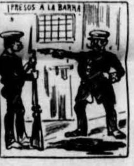
Volent posar al cap fer fum d'algun pobret dels d'allí, no va faltar qui va dir: —Aquel que se nueva... ¡pum!