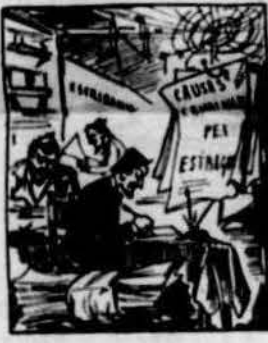
Y pels estragos fatals que dels petardos van dirse, a lo menos van obrirse trenta causas criminals.