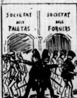
Aumentan los disbarats dels servidores dels burgesos, posant a molts obrers presos tot suspenent societats.