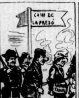
Quan va estar ben ple de nar, amanillat ab cadenas y ab altres companys de penas a la preso aná de pas.