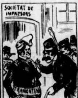
La policia s' estufa d' alegría xavacana, porque de La TRAMONTANA han agafat al que bufa.