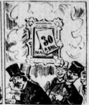
En mitj d'unió tan dubtosa lo 1. er de Maig arriba, volent uns la huelga activa y altres festa rigurosa.