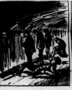
Com si ja se ls fes l' enterro baix d' uns barcos son portats, y allí pels peus amarrats en grossas barras de ferro.