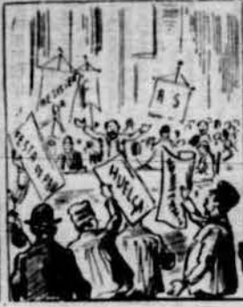
Van acudir al Congrés socialistas y anarquistas, ab projectes optimistas pera combatre al burgès.