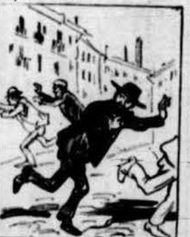
Al saber que aixís tractavan als que estavan agafats, molts que's deyan avansats a marches doblas guillavan.