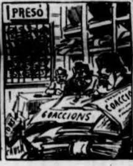
Además per coaccions tanta gent entretenian, que dar l' abast no podian ni ls jutjes ni las presons.