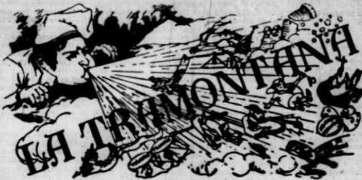
PERIÒDICH POLITICH VERMELL

Es més lletre començarem Es més lletre començarem. Les drets individuals son imprescriptibles, inalienables i intransmissibles. © Legislar la Llibertat bota pretent de garantirla, o com ometre atencat contra ella. © La llibertat propia no es all abent comença la llibertat ajena. Es lletre, donchs, el individu fer tot lo que no perjudiqui a un altre. © La resignació que produeix la religió no es més que la fórmula del engany ab que's preté perpetuar la injusticia social en lo mon. © Las religions son males d'aborris que viuen de la cresta d'admetre capítols en la terra, assegurant pagar crecients interessos al col.