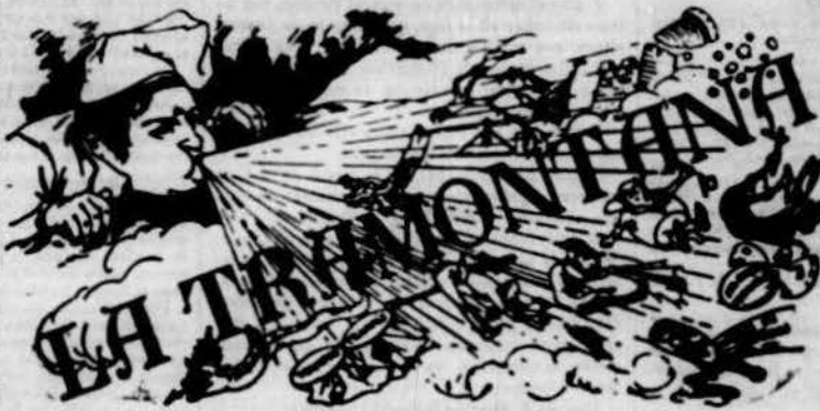
PERIÒDICH POLÍTICH VERMELL

En més drets ensan d'oban. En més drets ensan d'oban. Les drets individuals son Imprescriptibles, Inalienables i intransmissibles. • Legislar la Llibertat heu present de garantir, es com entre atenció contra ella. • La Llibertat propi acaba ell absent comença la Llibertat ajena. Es llibre, donchs, al individu for tot lo que no perjudiqui a un altre. • La resignació que produeix les religions no es més que la fórmula del segurey ab que s'eviti perpetuar la in- justícia social en lo mon. • Les religions son causes d'obstacles que viden de la causa d'admetre capítols en la terra, assegurant pagar certos interessos al cel.