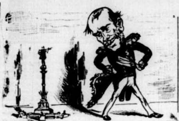
Tal fama prompte ha adquirit, que á Colon me'l veu petit.