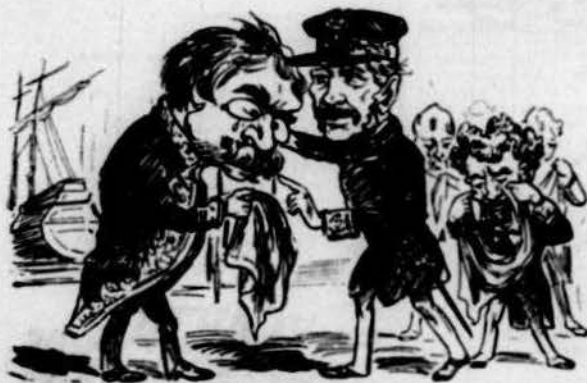
Despedida que contrista per aná a fer la conquesta.