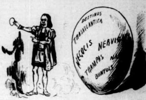
Com l'ou de Colon l'halaga ell té aquest gros, que'ns amaga.