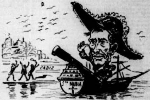
Sens vapor y sense vela s'embarca en la carabela.