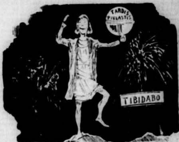
Projecte de sombras xinesco-eléctricas al Tibidabo.