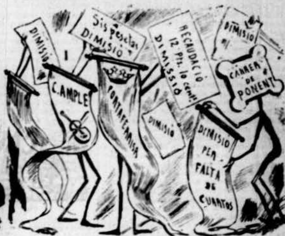
Resultat práctic de las comissions dels carrers.