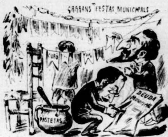
Dos regidors d'upa posant son carrer de festa.