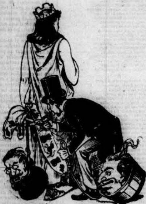
En Silvela, am grand cautela y no poca astucia y manya, gran llufista s'ens revela. ¡Vaya una llufa que á Espanya me li ha plantat en Silvela!