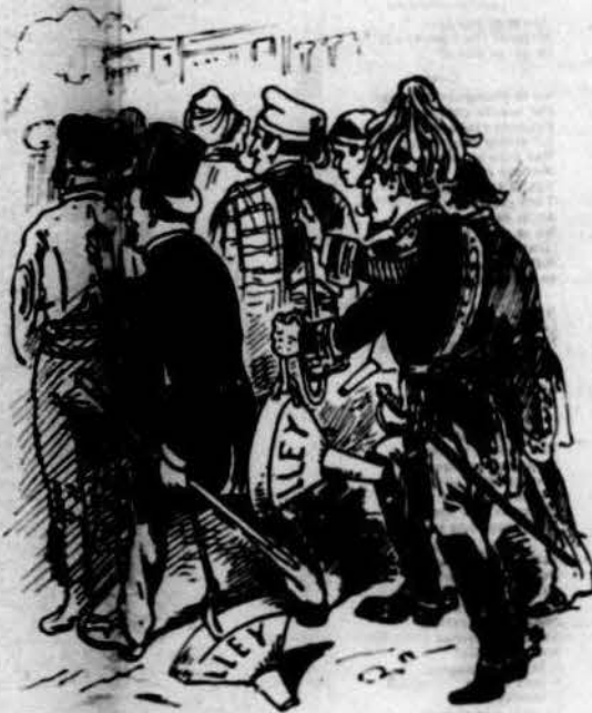
En nom d'un Déu ó d'un rey, d'un president ó d'un noble ó de son propi servey, sempre li penjan al poble la gran llufa de la lley.