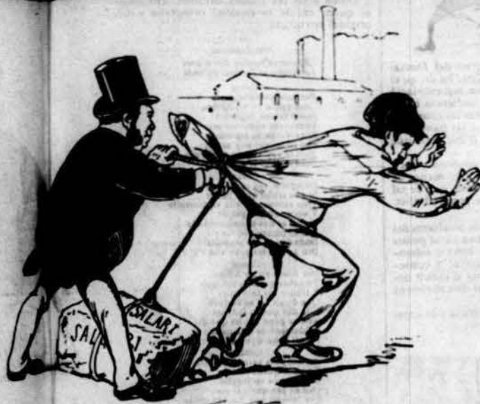
A l'infelis proletari, com explotario es proposan, d'orgul burgès al desvari pesanta llufa li posan! donantli el nom de salari.