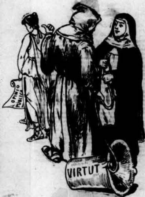
Aquets dos, am l'intenció d'amagar bé tot l'engrut de la seva condició, volen posá á l'Opinió la llufa de la virtut.