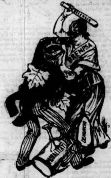
Pretenint posá un dogal La Fulla a sos adversari, de la prempsa es fa fiscal, volent posarli ¡falsari! la llufa de la moral.