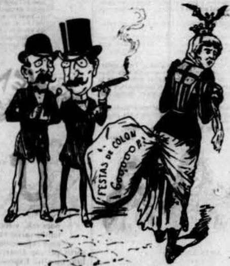
D'haver passat cert afront Barcelona està que bufa y de vergonya es confon. ¡Encare porta la llufa de las festas de Colon!