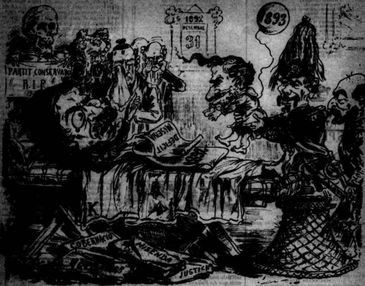
Derrers moments de l'any 1892 y herencia que deixa al 1893