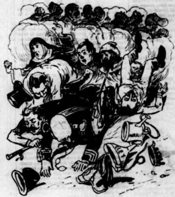
Curarem dels mals aquets quand els burlats, tots units, sent respectar nostros drets, decixèm, á llufas y á pets, als lluferos suprimits.