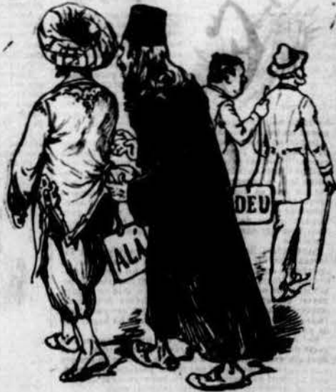
La classe sacerdotal, per ferse tot el món seu, d'un creyent fa un carcamal. ¡Quina llufa més cabal s'ens posa amb el nom de 'Déu'!