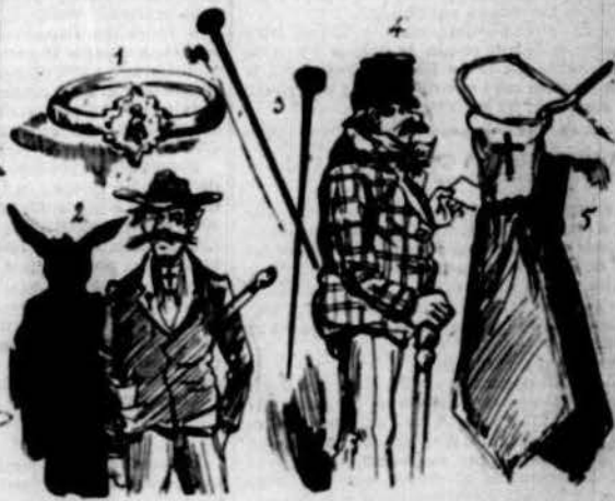
1, 3 y 5: Contrasenyas.—2. Set vots.—4. Pinxo oficial.