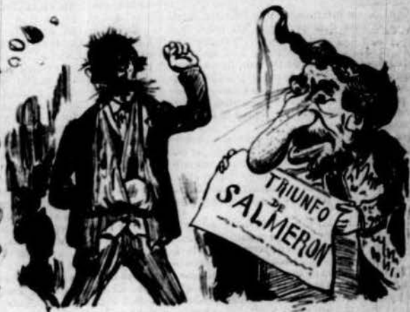
Com ha cobrat son treball.