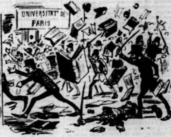
A Paris la policia d'estudiants fa caceria.