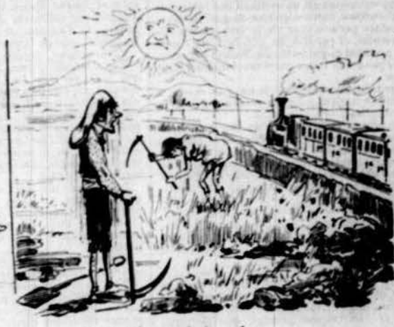
Y el pobre sufreix calor mentres á banys va el senyor.