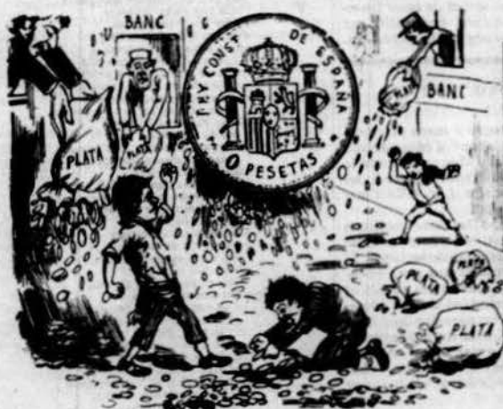
Diuen que tant s'abaratá que tothom llessa la plata.