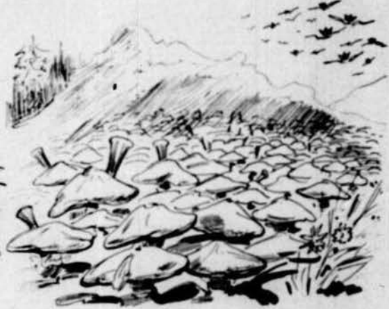
Am las derrerias plujas de motins hi haurà cullita de bolets earlins.