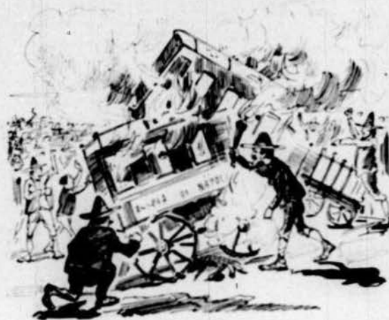
A Nàpols una huelga m'els fa fieros perque aixis fan la huelga allí els cotxeros.