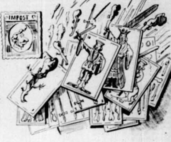
Pel nou impost las cartas van queixarse y ans de pagarlo intentan sublevarse.