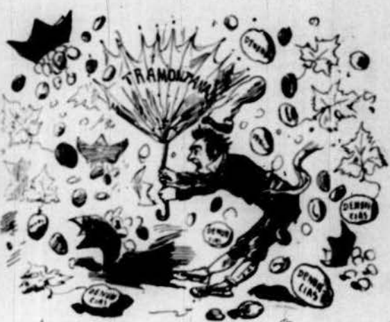
Calentas y grossas y... am fulla