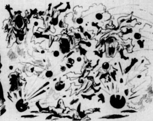
Castanyas de cristiá