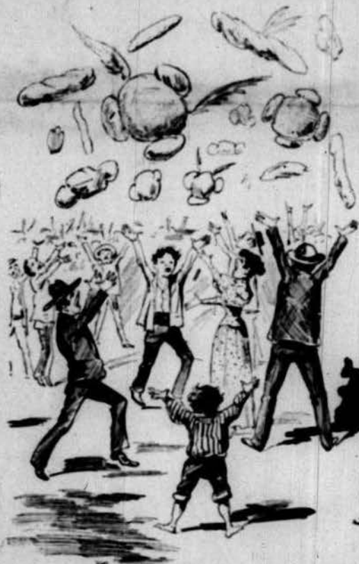
Espectacle divertit apujantse el pa a Madrid.