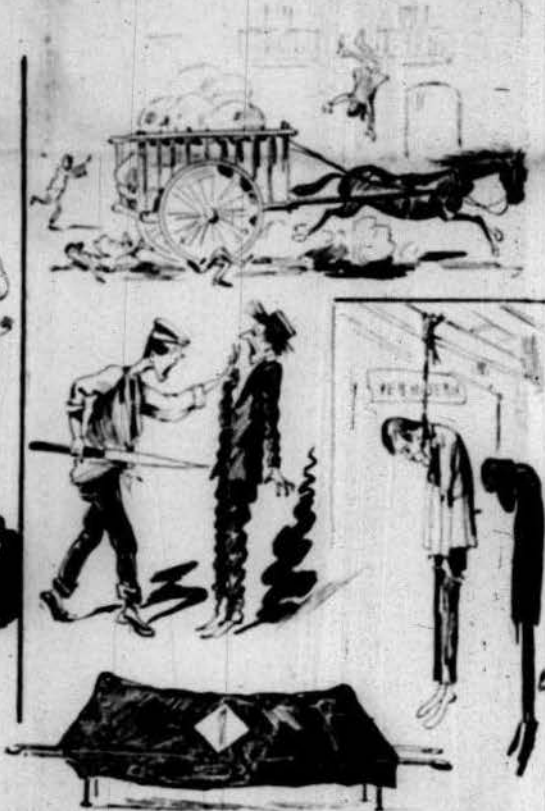
Y per alivio de mals desgracias fenomenals.