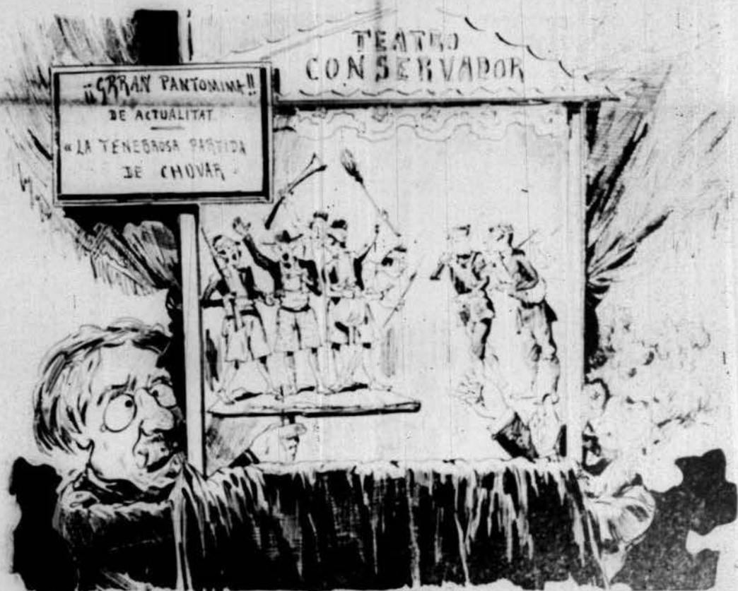
Escena més culminant d'una comedia important que tot hom seure ha pogut