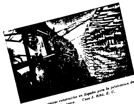
Instalaciones únicas construídas en España para la fabricación de redes para la pesca. Casa J. Ribó, E. C.