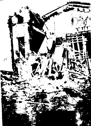
Detalles de los destrozos producidos por el bombardeo en la barriada denominada «Urbanización Materos»

Esos son los calificativos que se merecen los que sistemáticamente ensangrientan el suelo español, con el único objetivo de imponer la esclavitud y estrangular las altas aspiraciones de libertad del proletariado. ¡Obreros de la Iberia libre! Organícemos fuertemente y con una sola consigna sigamos adelante hasta aplastar al fascismo internacional.