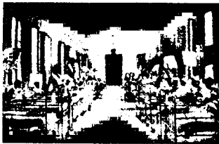
Sala de niños impedidos

Se dudaba de la capacidad conservadora popular, improvisada por un