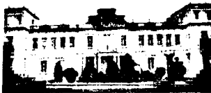
Hospital proletario. Fachada principal

El alto sentido de nuestro pueblo, se apresuró a comenzar una tarea reconstructiva revolucionaria, al mismo tiempo que iba derrumbándose el tinglado de los intereses creados a la sombra de una moral hipócrita y de conveniencia de casta.