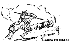
Para leer con la nariz tapada

A los compañeros que residen en las localidades donde moran estos palpos asquerosos, solo les recomendamos que paguen mercedamente su obra ruin y cobarde; por nuestra parte, un escupitajo en el rostro.