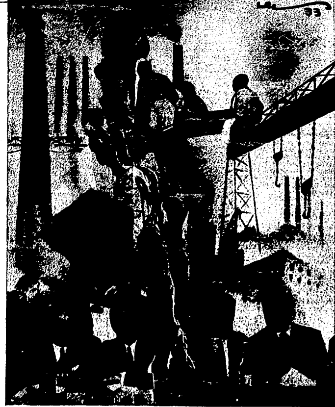
La economía política de la República ha fracasado, los intelectuales de este régimen de comitivas inmensas brindan con los polillos de historial más abyecto. Y mientras se huele todo el pueblo y fruscaso del sistema capitalista y en el de las copas de champagne se reflejan las rasuras crispadas de angustia de los hambrientos, las familias, las grandes industrias a las que la burguesía ha expoliado todo lo que podía proporcionarles un placer, un vicio, son poco muertos que precipita el fin. En el mañana post-revolucionario costará las máquinas un potente aliento liberado.