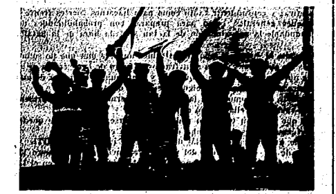
Los marinos exteriorizan su alegría billonera después de la caída de Machado

irru venáneo y asesino sin fronteras. Los señores de la Prensa, en cuanto les dan un almuerzo, con varias excepciones, se convierten en falderillos cabrilecos. [De algo han de vivir esos pobres chicos de la prensa!] Pero ha sido algo imprevisto el estrepitoso derrumbamiento de un sistema de crímenes espantables, de barbaridades llevadas a lo inconcebible. Fué un desgranamiento que ni los más avisados y los más que se estimaban en la intimidad de la conspiración revolucionaria, pudimos avizorar en su enorme magnitud. El sistema criminal, se había consolidado por el terror. Machado, jefe de la gavilla de asesinos que habían asilado el manejo de la cosa pública, era el punto de mira, desde donde tomaban puntería todos los sicarios, los asesinos, los vítores, los talibanes. Fuese en fuga este miserable y vulgar criminal, como se vino al suelo, como si se tratara de un castillo de naipes. Estaba cimentado sobre la fuerza de las ametralladoras de sus obreros; pero sorprendidos ante la furia cobardo y miserable del que no llamaba asimismo valiente, todo quisque se escondió, salvo aquellos elementos dedicados al crimen desde sus puestos políacos, para defender sus vidas amenazadas por los elementos del pueblo armado, para exterminar tanto bandido sanguinario que protegía un régimen criminal.