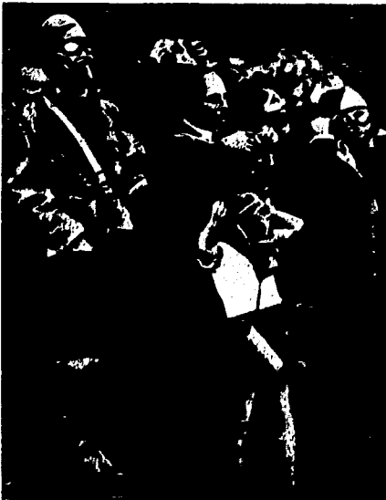
En París se enseña al público la forma de usar los misiles como los gases asfixiantes. Ejercicios prácticos realizados en el Boulevard des Invalides

¿Si no ha de haber guerra, por qué se enseña a manejar carretas a ningún pueblo? ¿Por qué perder un tiempo precioso que puede aprovecharse en algo más útil, como sería, por ejemplo, explicar los desastrosos de las guerras a través de todos los tiempos?