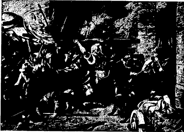
La historia está llena de gestas campesinas heroicas en defensa del derecho a la vida contra los explotadores. El cuadro que reproducimos refleja el ataque de los campesinos alemanes a Munich en 1525. Grandes y valientes fueron las tentativas emancipadoras de los obreros de las ciudades, pero las de los siervos de la gleba en todos los tiempos son merecedoras de recuerdos. Un día, fruto de tantos esfuerzos y de tanto heroísmo, la tierra será libre y con el trabajo y la solidaridad de todos, dará comienzo el siglo de oro venturoso soñado por los poetas como comienzo y no como coronamiento de la historia humana.

Para el envío de fondos, dirigirse a Mme. A. Faucher, 2 Rue de la Cour des Noyés, Paris (XX ème ).