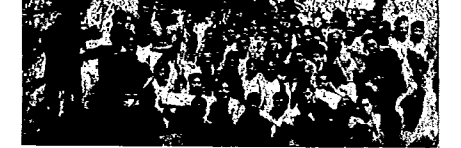
Grupo de compañeros de los Juventudes Libertarias de Granada en fin de camaradería en los Cachorros, el 2 de septiembre.