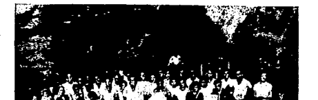
En Vitoria se celebró a mediados de mes una junta bastante concurrida, con una charla oportuna sobre la educación, etc. Durante esa junta se recomendaron 150 pesetas para los presos.