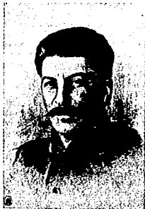
J. STALIN señor de todas las Rusias

el paso con aire tan marcial que para sí envidiaran las formaciones hitlerianas, maestras en automatismo geométrico-belicoso, portaba banderas en profusión. Banderas y un colosal retrato del soberano Stalin. En la tribuna desde donde presidían el desfile las autoridades del Partido, erguiese otra no menor ef-