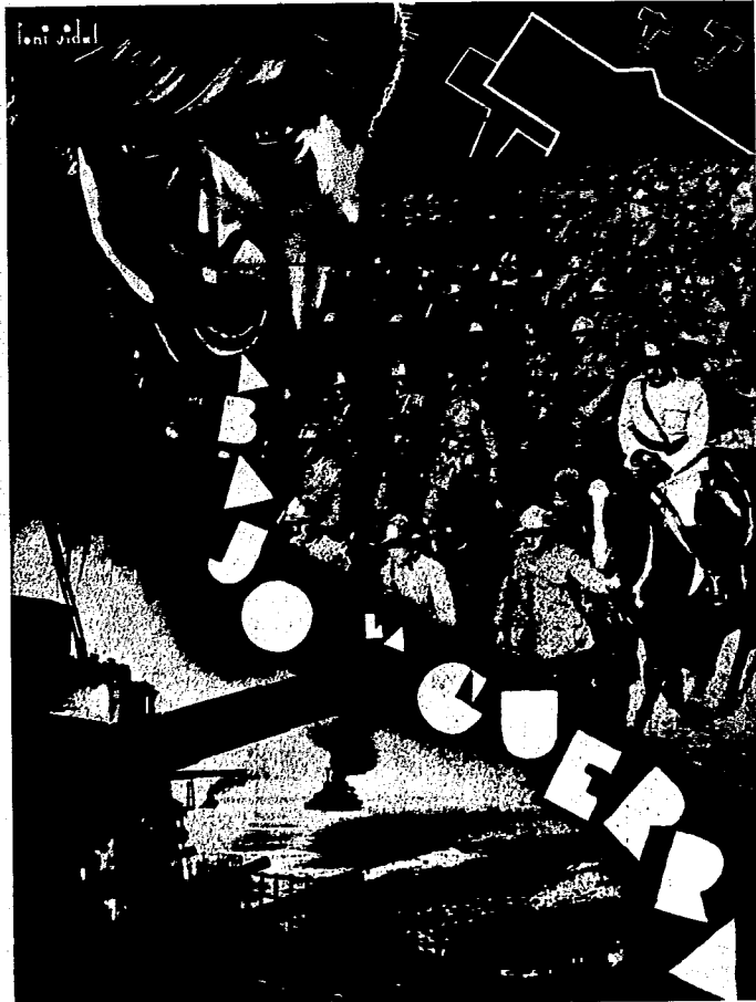
Contra la guerra, que parece ya un hecho inevitable, no ven los hombres de Estado y los peritos militares otra solución que la de prepararse para hacer al enemigo más daños de los causados por él. A esa altura moral hemos llegado después de siglos de cristianismo, de estalinismo y de capitalismo.

Personalmente no conocía a Fabbri, pero desde 1925 mantenía con él una correspondencia epistolar bastante frecuente. Primero desde Bolonia, Italia, y des-