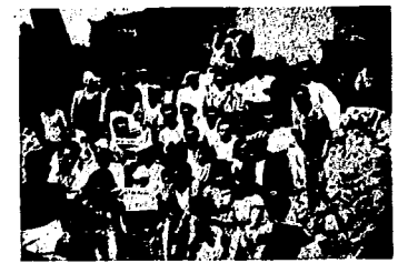
En Lunel (Francia) se celebró el 23 de junio una jira a la que acudieron compañeros de los pueblos circunvecinos.