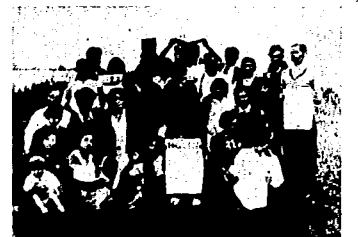
Compañeros de Toulouse (Francia) en una fiesta campesina de camaradería.