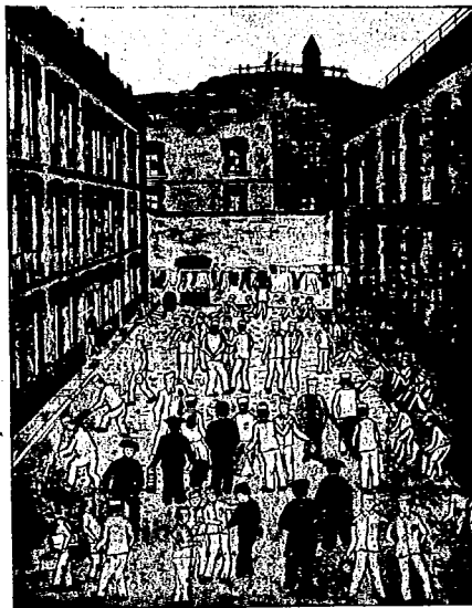
En el fatídico fuerte de San Cristóbal, un preso se entretuvo en dibujar esta visión del patio lúgubre