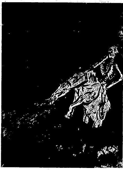
El año 1936 se asegura como el año del comienzo de la nueva carnicería humana mundial. ¡Solamente los trabajadores pueden evitar la catástrofe!

EN EL CAPE... DIALOGOS por Erico Malatesta Primera edición completa 112 páginas. 0'75 pesetas.